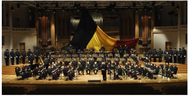
La Musique Royale